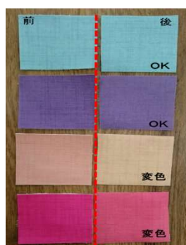
業界他社品は16色中2色で変色